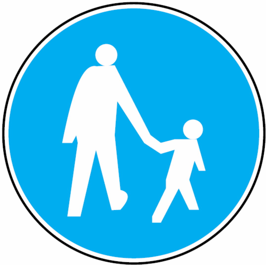
C-16: Droga dla pieszych