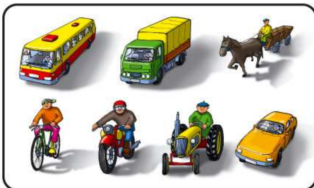
Kierowcy, pasażerowie, powoźący