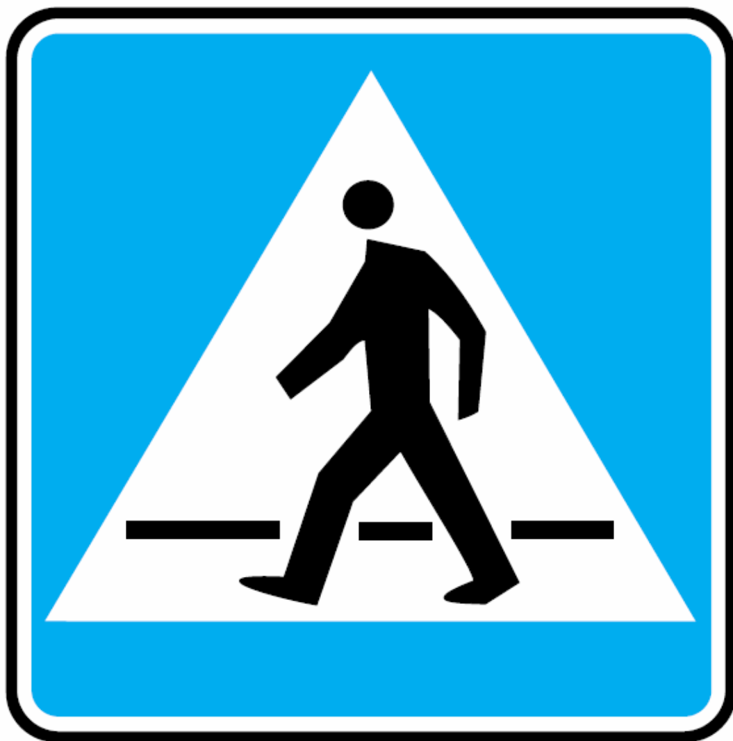
D-6: Przejście dla pieszych